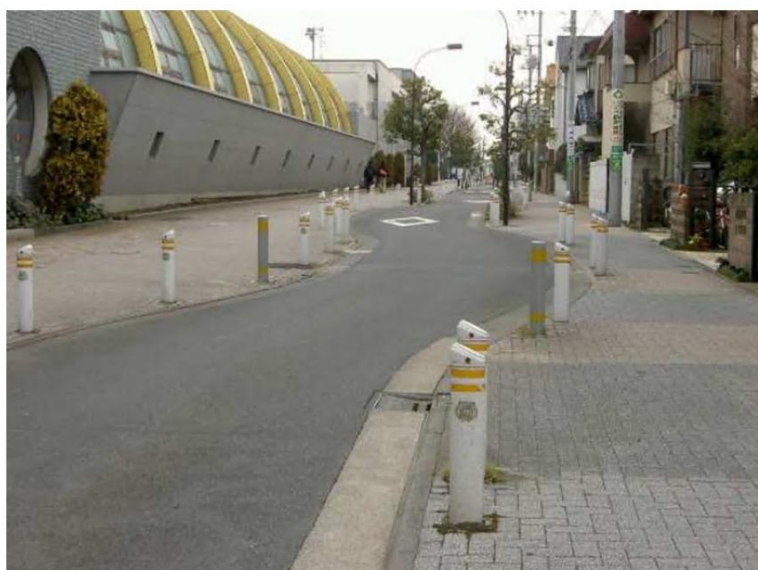
図 シケイン設置例