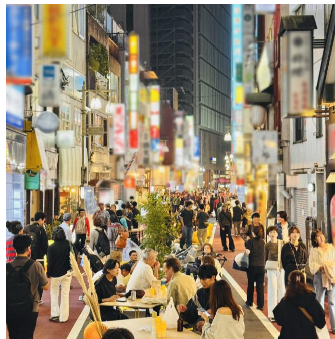
令和7年10月のパークロードでの社会実験

地元の商店会とも協力して南口駅前のパークロードなどでの社会実験を行い、まちの将来像策定につなげます。