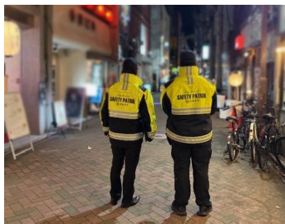
安全パトロール隊「ブルーキャップ」

安全パトロール隊「ブルーキャップ」「ホワイトイーグル」のパトロールを強化します。