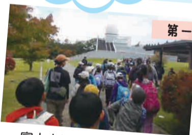
富士山レーダードーム見学