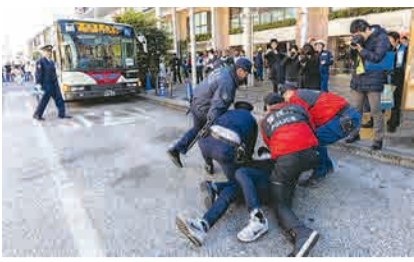
前回の訓練の様子

地下鉄サリン事件から30年。吉祥寺駅周辺もテロ攻撃の標的となり得る大規模集客施設が多いことから、NBCテロを想定した実動訓練を実施。 ▶日時：1月23日(金)午後2時～3時▶場所：吉祥寺駅「はなこみち」および平和通り▶共催：武蔵野警察署、武蔵野消防署、JR吉祥寺駅、関東バス、吉祥寺活性化協議会、平和通り商店会協同組合など▶問：安全対策課☎60-1916