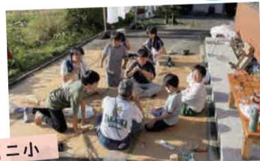
民宿の方との触れ合い