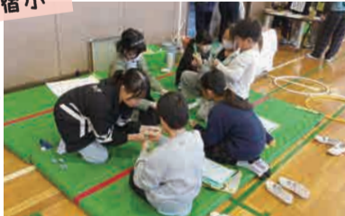
セカンドフェスティバル