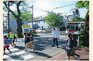
市民安全パトロール隊

総勢53名の市民ボランティアにより、地域の防犯パトロールや、子どもたちの登下校時の見守り活動を実施しています。また、警察やホワイトイーグル、ブルーキャップと共に、定期的に活動報告や情報交換を行うなど、緊密に連携を取りながら活動しています。