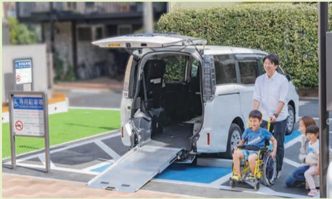
※一般車両は近隣の民間駐車場をご利用ください