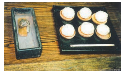
供え物の火口箱とまんじゅう