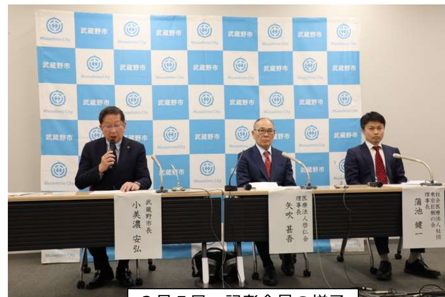
3月5日 記者会見の様子