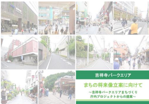
図 1 吉祥寺パークエリアまちの将来像立案に向けて