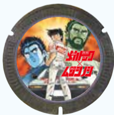
よろしくメカドック ©次原隆二/コアミックス 1982

令和5年10月に(株)コアミックスと連携して吉祥寺にデザインマンホールを設置しました。まちの回遊を楽しみながら、ぜひ探してみてください。