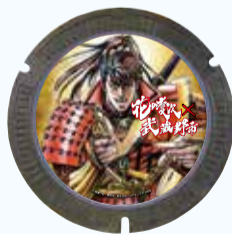
花の慶次一雲のかなたにー ©陸奥一郎・原哲夫・麻生未央/コアミックス 1990