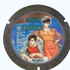
シティーハンター ©北条司/コアミックス 1985