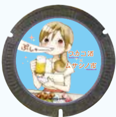
ワカコ酒 ©新久千映/コアミックス