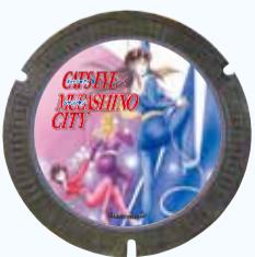
キャッツ♥アイ ©北条司/コアミックス 1981