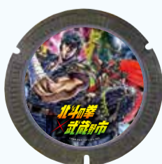
北斗の拳 ©武論尊・原哲夫/コアミックス 1983