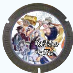
終末のワルキューレ ©アジチカ・梅村真也・フクイタクミ/コアミックス