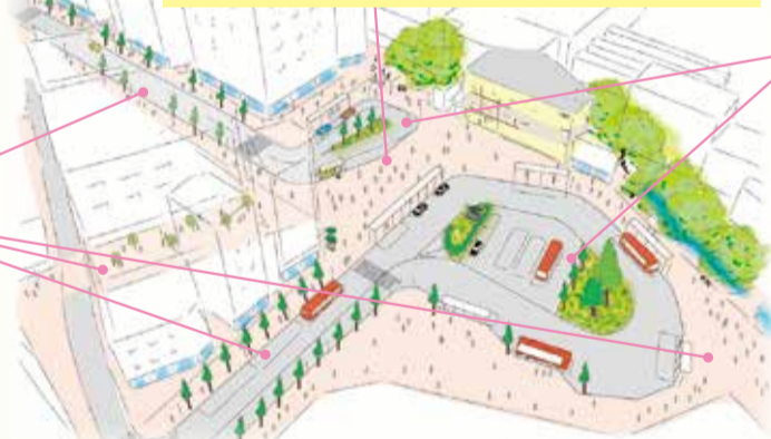
※図はイメージの一例です。駅前広場や道路は拡張範囲や設計条件などでさまざまなパターンが考えられます。