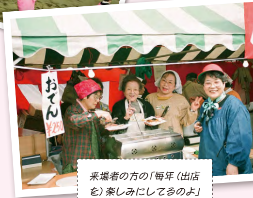
来場者の方の「毎年(出店を)楽しみにしてるのよ」の言葉がいつも励みに。