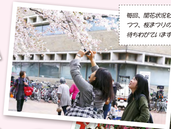
毎回、開花状況を気にしつつ、桜まつりの開催を待ちわびています。