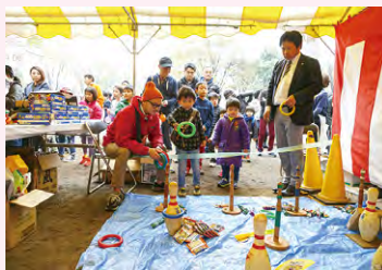
バザーやゲームなども充実

武蔵野市商店会や市民団体などによる、食を中心とした約40店の屋台が出店します。中でも見逃せないのが友好都市のブース。イワナの塩焼きをはじめ、地酒の試飲（升は別売り）、おやきといった各地域自慢の名産品・特産品の数々が一堂に会するとあって毎年大盛況です。買い物はもちろん、人と人との触れ合いがあるのも魅力です。