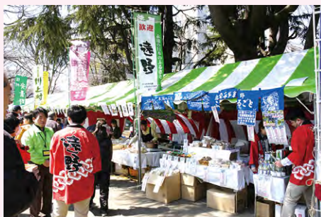
各友好都市の方々の出店の様子

武蔵野市は岩手県遠野市、山形県酒田市、新潟県長岡市、長野県安曇野市および川上村、富山県南砺市、千葉県南房総市、鳥取県岩美町、広島県大崎上島町の9つの市町村と友好関係を結んでいます。「桜まつり」では、友好都市との交流も楽しみのひとつ。当日は各市町村が縁日広場への出店や抽選会の品など、いろいろな形でお祭りを盛り上げてくれます。このほか、友好都市の特産品や市内農作物を取り扱うアンテナショップ「麦わら帽子」も出店予定です。