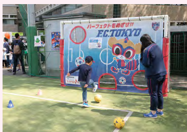
ミニゲームスタイルのスポーツ体験も用意

大型のエアースト遊具「フアフア」やミニボウリングなど、数種のメニューが用意された子どもたちの遊び場です。バッジづくりなどの体験コーナーも設けられているので、アクティブ派はもちろん、じっくりモノづくりに向き合いたい子どもも楽しめます。今年は、会場を緑町スポーツ広場に移動して行われます。