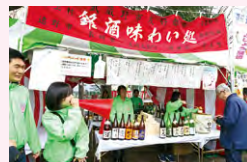
友好都市の地酒試飲コーナーは毎回大人気

武蔵野市商店会や市民団体などによる、食を中心とした約40店の屋台が出店します。中でも見逃せないのが友好都市のブース。イワナの塩焼きをはじめ、地酒の試飲（升は別売り）、おやきといった各地域自慢の名産品・特産品の数々が一堂に会するとあって毎年大盛況です。買い物はもちろん、人と人との触れ合いがあるのも魅力です。