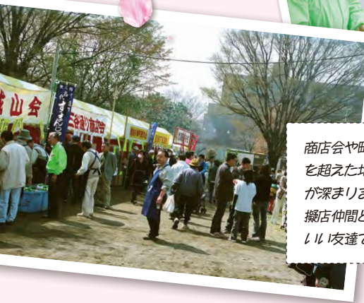
商店会や町会の垣根を超えた地域の交流が深まりました。模範店仲間とは今でもいい友達です。