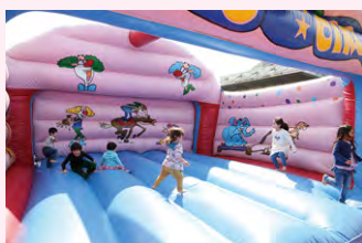
大型のトランポリン「フアフア」が登場！