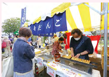
グルメを中心に多彩な屋台が軒を連ねます