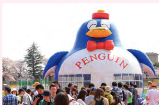
子どもたちががのびのびと遊べる会場です