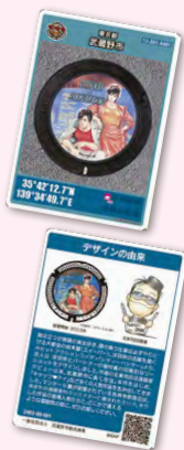
「シティーハンター」マンホールカード

桜の季節があつという間に過ぎ去るように、武蔵野桜まつりもたった一日のイベントですが、市民や関係者の方々と一緒に考え、準備を進める時間は、(大変ですが)とても充実しています。私も初めての桜まつり。皆さんを、満開の桜の舞う会場でお待ちしています！