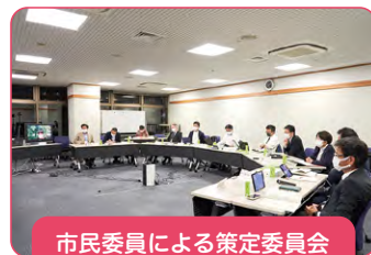
市民委員による策定委員会 (令和4年8月設置)