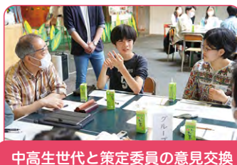
中学生世代と策定委員の意見交換 (令和5年5月)