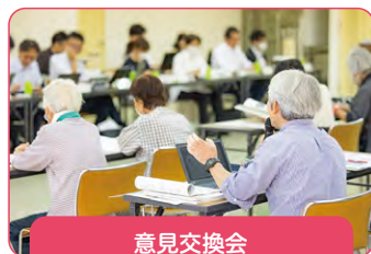
意見交換会 (令和5年9月・10月)