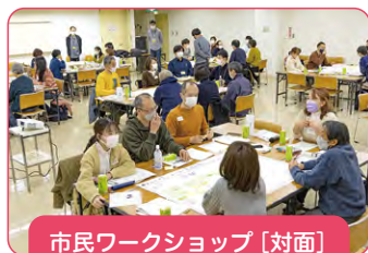
市民ワークショップ [対面] (令和5年3月)