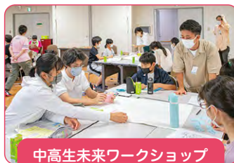
中学生未来ワークショップ (令和4年7月)