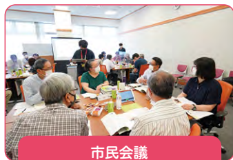
市民会議 (令和4年6月・7月)