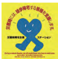
災害時帰宅支援ステーションステッカー

ルートは、幹線道路を通るようにしましょう。広く歩きやすい、給水拠点やトイレなどの帰宅支援ポイント(災害時帰宅支援ステーション)が整っているなどのメリットがあります。