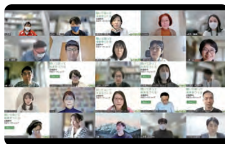
オンラインワークショップ

また、市民同士の活発な議論と学び合いを促し、参加者同士の一体感や今後の市政参加への意欲醸成を図るため、市民ファシリテーター*の活用や参加後の市政情報の提供などにより、次なる市政参加につながる取組みを行う。