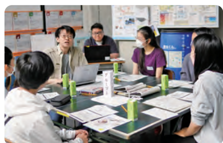
中高生世代と策定委員会の意見交換