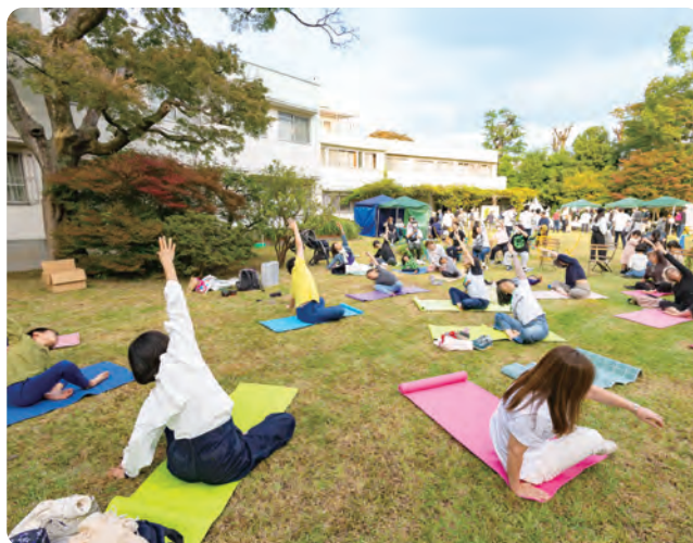
旧赤星鉄馬邸社会実験