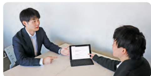
DX推進による書かない窓口の取組み

職員のワーク・ライフ・マネジメント*を支援しつつ、質の高い市民サービスを提供するため、また社会・経済の変化に対応していくため、武蔵野市第七次総合情報化基本計画に基づき、行政文書の電子化のほか、AI*やクラウド等のデジタル技術の活用により、行政サービスの利便性向