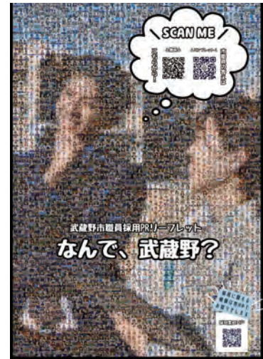
職員採用PRリーフレット

また、市内外の有識者、国、他の自治体、民間企業及び調査研究機関等とのネットワークの強化、交流や派遣研修の充実を図るとともに、特に自治体DX*推進のための取組みを強化する。加えて、副業と兼業の進展に伴い、専門的な知見、技術を有する市民を活用した人材登用についても研究する。