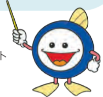
下水道マスコットキャラクター スイスイ

日々の生活で排出している汚水を、市外にある水再生センター（下水処理場）まで排水し、浄化したうえで川や海へ放流しています。