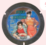
「シティーハンター」のデザインマンホール

5年10月、(株)コアミックスと連携し、漫画作品を活用したデザインマンホールを設置しました。吉祥寺駅北口付近に計7カ所あり、観光推進、地域活性化および下水道事業の啓発が目的です。