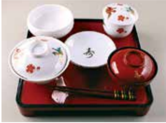
お食い初め道具一式

子育てを取り巻く環境の変化を、子どもに関する年中行事や民俗資料を通して紹介します。