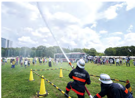
はらっぱ防災フェスタの様子