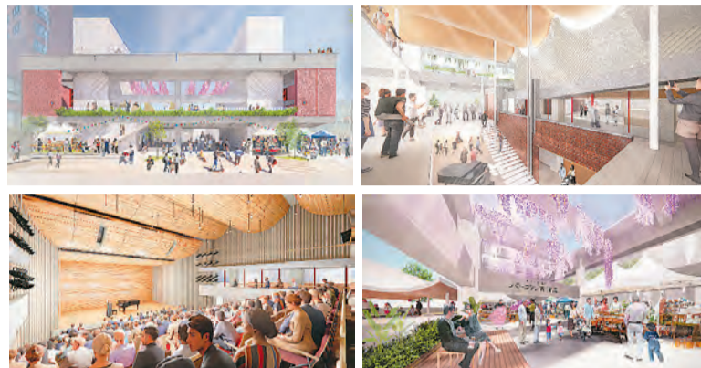
※画像はイメージです。今後変更になる可能性があります

(株)小堀哲夫建築設計事務所に決定しました。令和7年10月工事着工、9年9月開館を想定しています(変更の可能性あり) ▶ 問：市民活動推進課 ☎60-1831