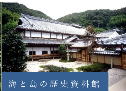
海と島の歴史資料館