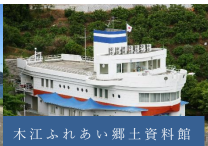
木江ふれあい郷土資料館

【日程】2泊3日 ※行程詳細は裏面参照 令和6年 1月26日(金)～1月28日(日)