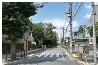
市道第16号線電柱撤去前