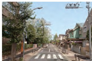
電柱撤去後(イメージ)