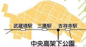
中央高架下公園について

※同公園の利用時間は午前9時～午後5時です。近隣にお住まいの方々のご迷惑にならないよう、早朝夜間のご利用はお控えください