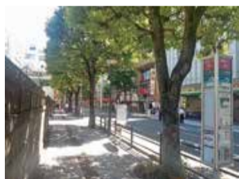
現在の吉祥寺駅周辺