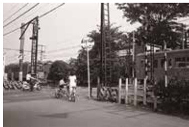
五宿踏切