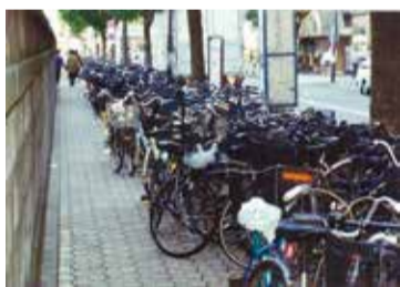
平成6年の吉祥寺駅周辺

▶日程: 10月22日(日)～31日(火) ▶問: 交通企画課 ☎60-1860