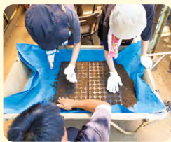
▲種苗パレットの上に均等に培養土を入れ、指で押したくぼみに1粒ずつ種を入れて土をかぶせます