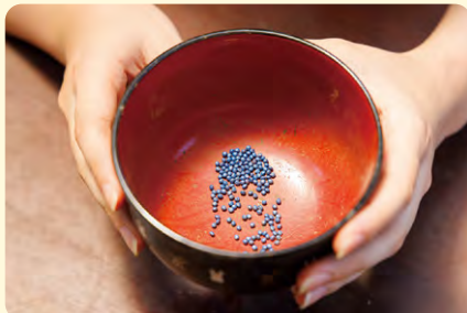
▲ブロッコリーの種。こんな小さな種からモリモリとしたブロッコリーが育つなんて不思議！

植物の性質や収穫時期によって、種をまくタイミングはいろいろ。何を、いつ、どれだけ採るのか、生産計画をしっかり立てながら、種をまきます。