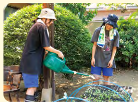
▲最後に、ジョウロで優しくたっぷりと水を掛けます