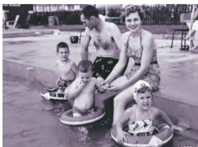
米軍人とその家族がプールで楽しむ様子(昭和29年撮影)

中島飛行機武蔵製作所跡地に設置された米軍宿舎グリーンパークが返還されて50年。戦争と武蔵野の「その後」を取り上げます。