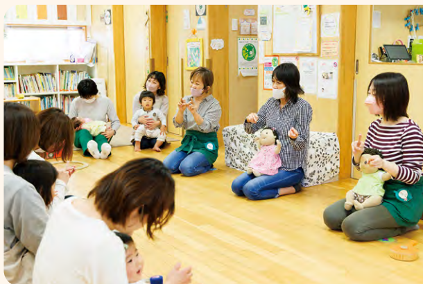
毎日みんなで一緒に手遊びを行います