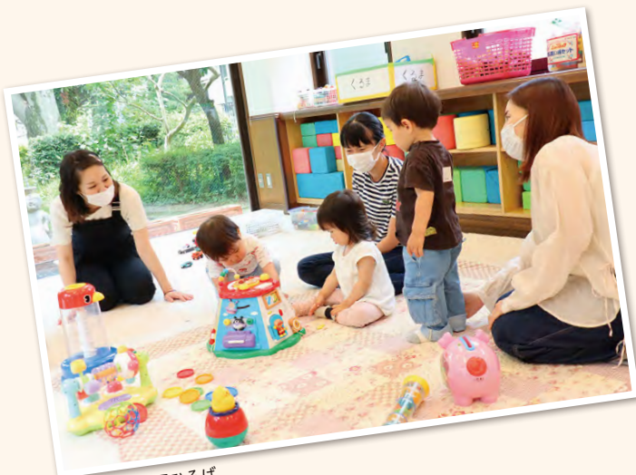
▲コミセン親子ひろば

子育て支援に関わる団体、行政機関が立場を超えて連携し「子育てひろばネットワーク」として子育て家庭を応援しています。