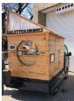
みちくさヒュッテ

桐たんすなどの廃材を使った珈琲のキッチンカー。コーヒーをいれた際に出るコーヒーかすを配布