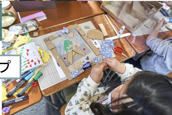
廃材ワークショップ