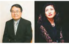
廣野嗣雄(東京藝術大学名誉教授)、松居直美(聖徳大学名誉教授)

オルガンコンクールの聴きどころを解説します。 日時: 8月29日(火)午後7時 場所: スイングホール 費用: 一般500円、㊦450円 出演: 廣野嗣雄(東京藝術大学名誉教授)、松居直美(聖徳大学名誉教授)