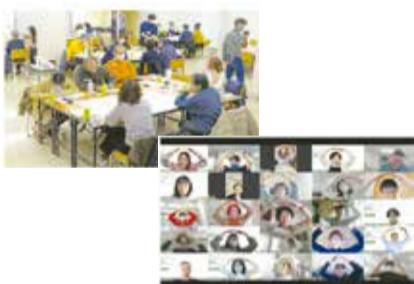
市民ワークショップの様子