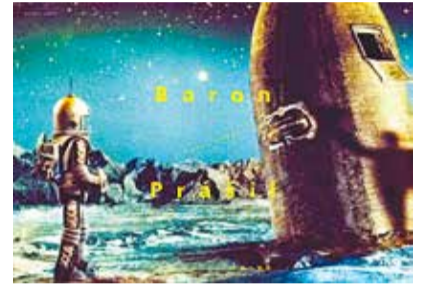
発売元：アイ・ヴィー・シー

「ほら男爵の冒険」(1961年、チェコ、カラー、85分、日本語字幕、監督…カレル・ゼマン)。