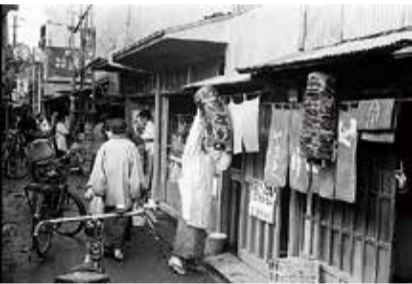
ハモニカ横丁