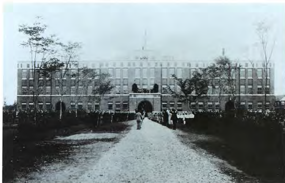
完成した成蹊学園本館への移転式 1924年(大正13年)10月20日