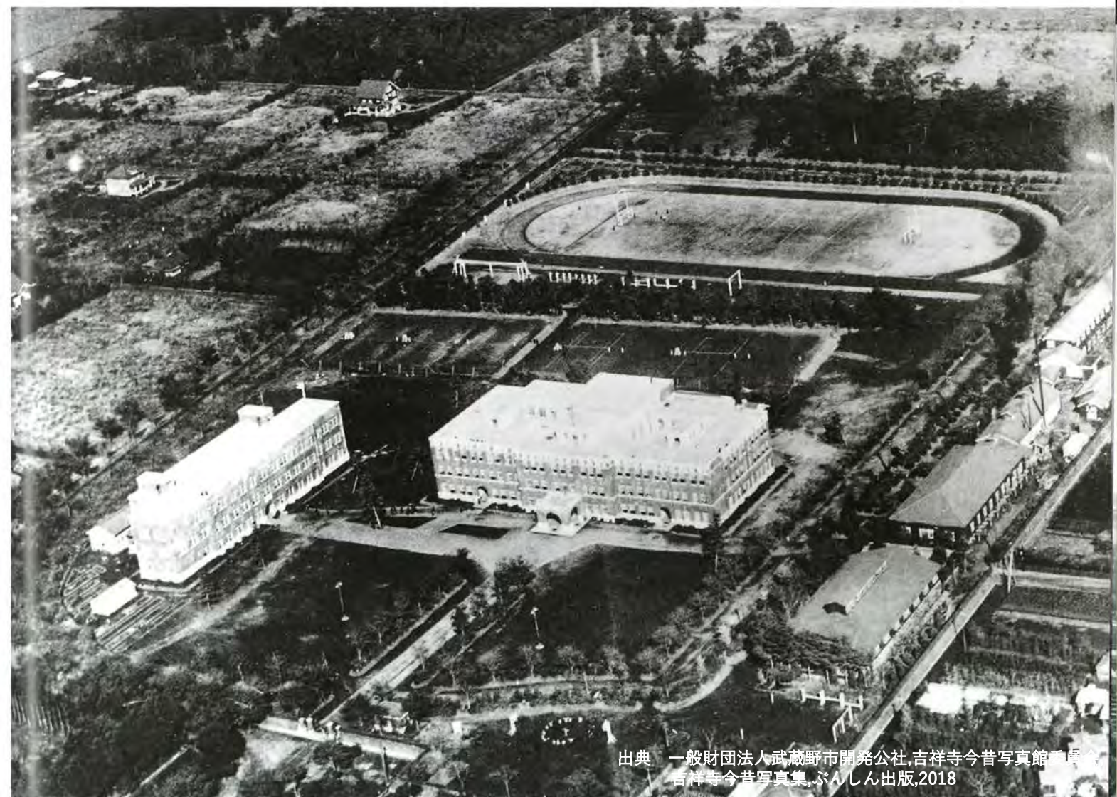
1932年(昭和7年)の航空写真