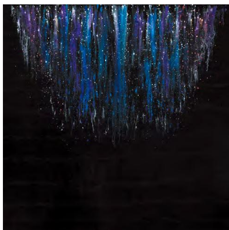
《悠久と星霜の彼方》2022年