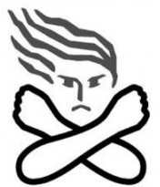
女性に対する暴力根絶のための シンボルマーク

セクシュアル・ハラスメントなど女性に対する暴力は、女性の人権を著しく侵害するものであり、女性に対する暴力根絶のための男女共同参画社会を形成していく上で克服すべき重要な課題です。