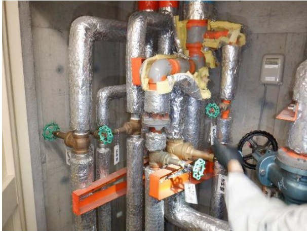
(1) 女子トイレパイプシャフト内給水縦配管