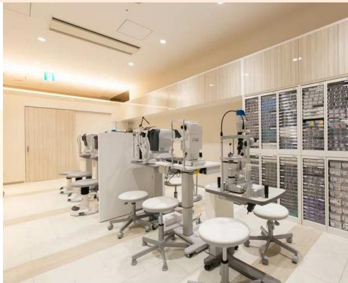
▲落ち着いた雰囲気とプライバシーを重視した空間のクリニックとなっている。

本制度を知ったきっかけ むさしの創業サポートネットの創業個別相談（産業振興課窓口）で紹介を受けて知りました。 事業場所に武蔵野市を選んだ理由 （決め手）は何ですか？