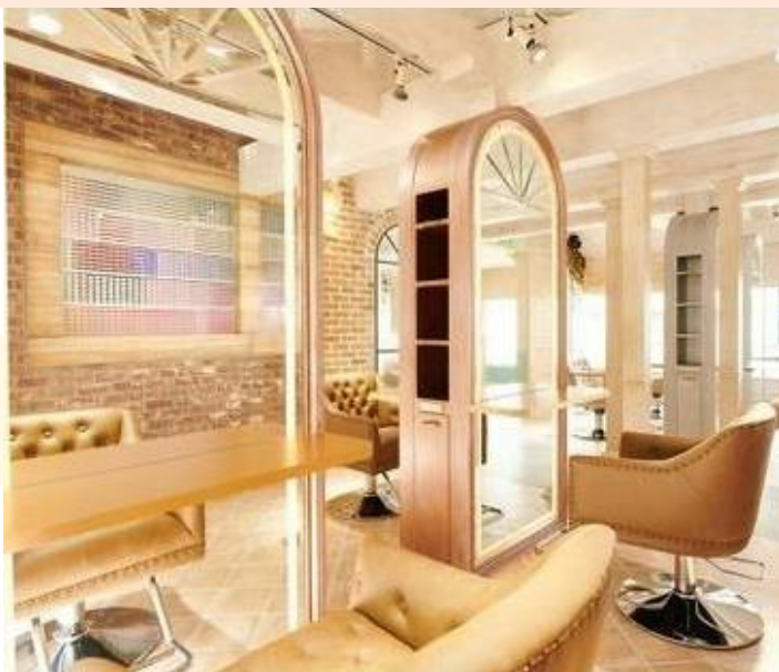
▲サロンに来ていただいたお客さまに、穏やかでゆったりとしたくつろぎのひと時を提供している。