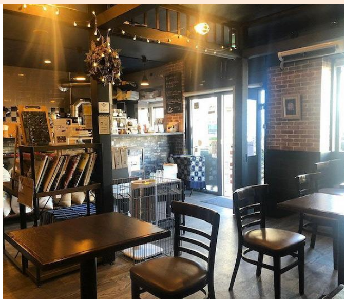
▲日本料理店の居抜き物件だったため、カフェらしく改装。 外観の瓦も、旧店舗の名残だそう。