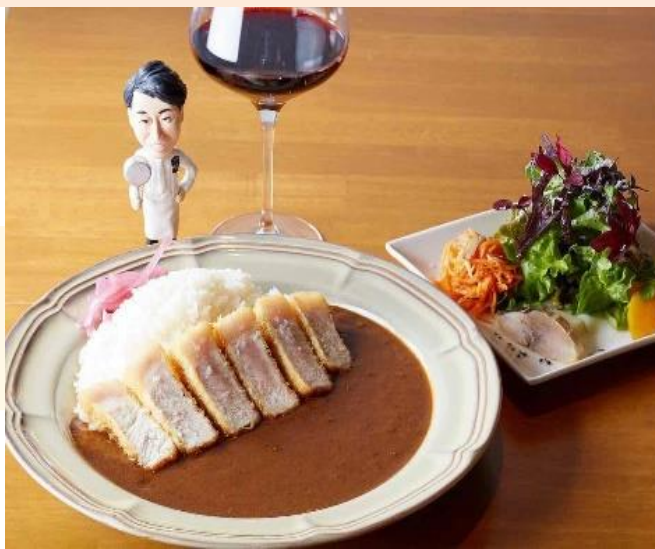
▲料理人歴 20 年のフレンチ出身シェフによるランチはモダンクラシックな欧風カレー。ディナーは厳選素材を使用したビストロ料理が楽しめる。

ころや、魅力的な新しいお店と、人気の老舗がいい意味でごちゃ混ぜになっているところに魅力を感じています。そのことは、自分がテーマに掲げるモダン×クラシックという、新旧をあわせていくという点でシンパシーを感じたので、武蔵野市を選びました。