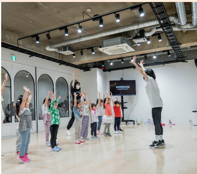
▲生徒たちにダンスを教える様子。モニターや音にもこだわっている。レッスンをお休みしてもオンラインでレッスンを受講できる。