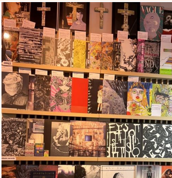
▲店内には、国内外を問わず、さまざまな品が置いてある。