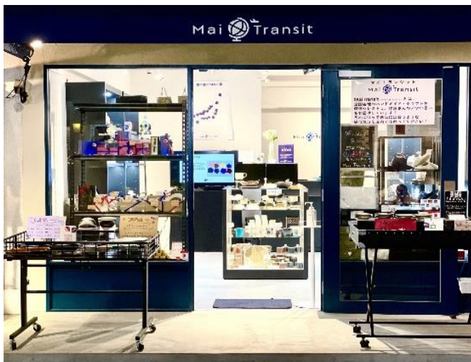
▲全国各地、時には国境を越え、各国のこだわりの逸品を紹介している。

その結果、吉祥寺のお客さまは、質の良いものへの関心が高い高い感度をもったかたが多いことが分かりました。それが私の考える店のブランドイメージに合っていたため、吉祥寺での出店を決めました。