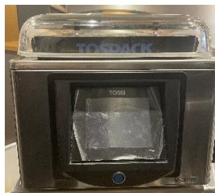
▲支援金を活用し購入した真空調理機

ころや、魅力的な新しいお店と、人気の老舗がいい意味でごちゃ混ぜになっているところに魅力を感じています。そのことは、自分がテーマに掲げるモダン×クラシックという、新旧をあわせていくという点でシンパシーを感じたので、武蔵野市を選びました。