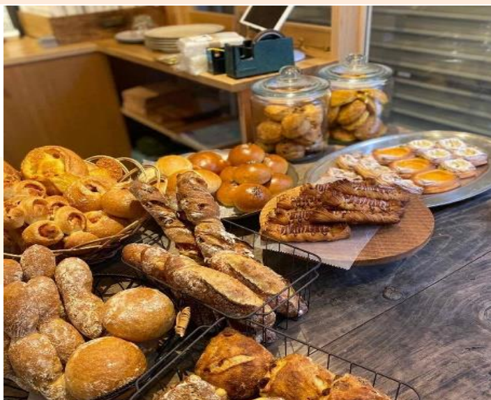
▲callas pain (カラスパン)