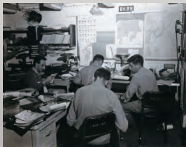
写真を分析している様子。手前の机の上に空中写真が積まれているのが見える。