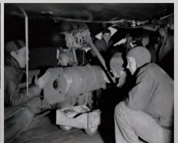
艦載機に500ポンド爆弾(約227kg)を搭載している様子。