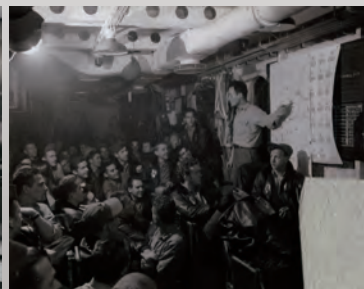
航空母艦Bunker Hillの艦内(1945年2月15日撮影)。壁面に関東地方を中心とした地図が掲げられている。