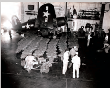
補給艦から搬入された爆弾とF4U。 RG80-Box1226-9