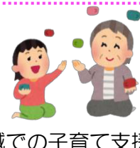
地域での子育て支援の手伝い