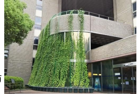
昨年のゴーヤのカーテンの様子