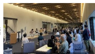
昨年の発表の様子

市内で活動するいきいきサロンの活動発表と作品展示。来ていただいた方も一緒に楽しめるプログラム（合唱、体操、手話ソング等）もあります。