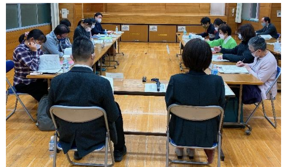
第7回改築懇談会の様子

引き続き改築懇談会・説明会等を開催し、広く皆様にご意見をいただきながら進めていきます。