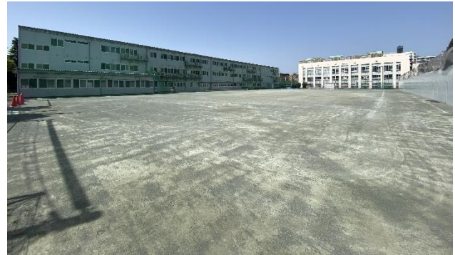
校庭全体と仮設校舎