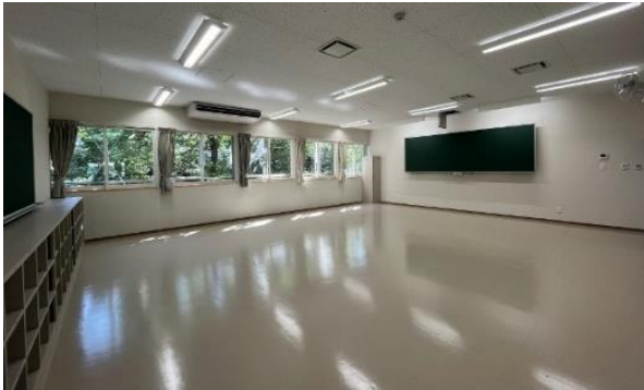
仮設校舎普通教室