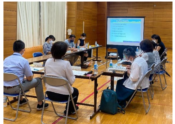
第1回改築懇談会の様子

令和4年9月21日(水)に開催された第2回改築懇談会では、第1回改築懇談会后に実施した児童・保護者・教職員アンケートの結果を共有し、井之頭小学校らしさについて意見交換を行いました。また、改築に当たってのコンセプトイメージ及び配置案を共有しました。今後も近隣住民アンケート等を実施し、広く皆様にご意見をいただきながら、改築基本計画を策定していきます。