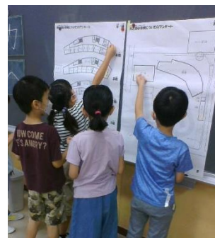
アンケートの様子

3位: 体育館・トレーニングルーム(169 票)…広い、雨でもできる、上から見渡せる