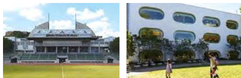
スポーツ施設、自然の村、武蔵野プレイス、吉祥寺図書館を運営

平成元年9月29日、総合体育館の完成を機に、市民スポーツの一層の振興を図るため、武蔵野スポーツ振興事業団として発足。平成22年4月には、従来の活動に加えて、「ひと・まち・情報創造館 武蔵野プレイス」の指定管理者となることに伴い、名称を武蔵野生涯学習振興事業団に変更しました。