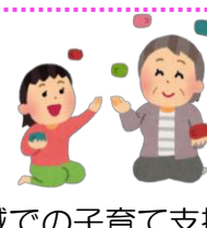
地域での子育て支援の手伝い