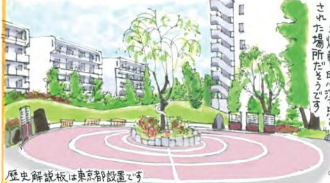
歴史解説板は東京都設置です

平成30年6月1日に開園 5枚も歴史解説板があります ここが爆撃の中心地点と された場所だそうです