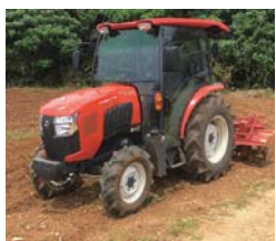
トラクターフォトスポット

農産物販売とじゃがいもの詰め放題(有料)、宝船の宝分けのほか、トラクターフォトスポットなどを用意しています。