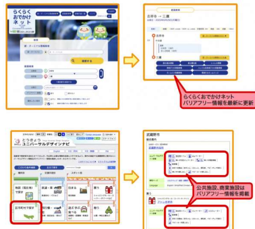
↑ 既存のコンテンツを利用した情報発信