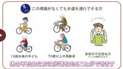
この標識がなくても歩道を通行できる方 13歳未満の子ども 70歳以上の高齢者 身体の不自由な方は歩道を走ることができます

例えば、この標識がある歩道は自転車で通行できます。また、13歳未満の子どもや70歳以上の高齢者の方などは、標識がなくても歩道を通行することができます。ただし、歩道を通行する際は徐行し、歩行者優先を心掛けましょう。