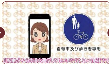
自転車とその歩道を通行してもいいですよという意味です