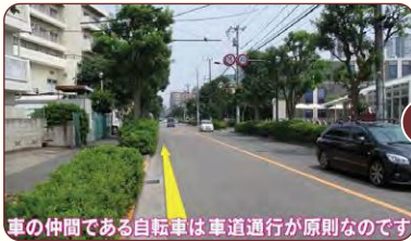
車の仲間である自転車は車道通行が原則なのです