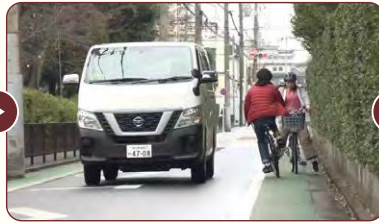
動画は、道路を自転車で通行中に、ルールを守らない自転車とぶつかりそうになる場面から始まります。この写真、皆さんは何がルール違反かすぐにわかりますか？