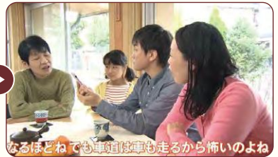
なるほどねでも車道は車も走るから怖いよね