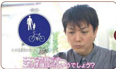
ここで問題です この標識は何というでしょう？