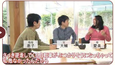
さっき逆走している自転車がぶつかりそうになっちゃって私危なかったんだから