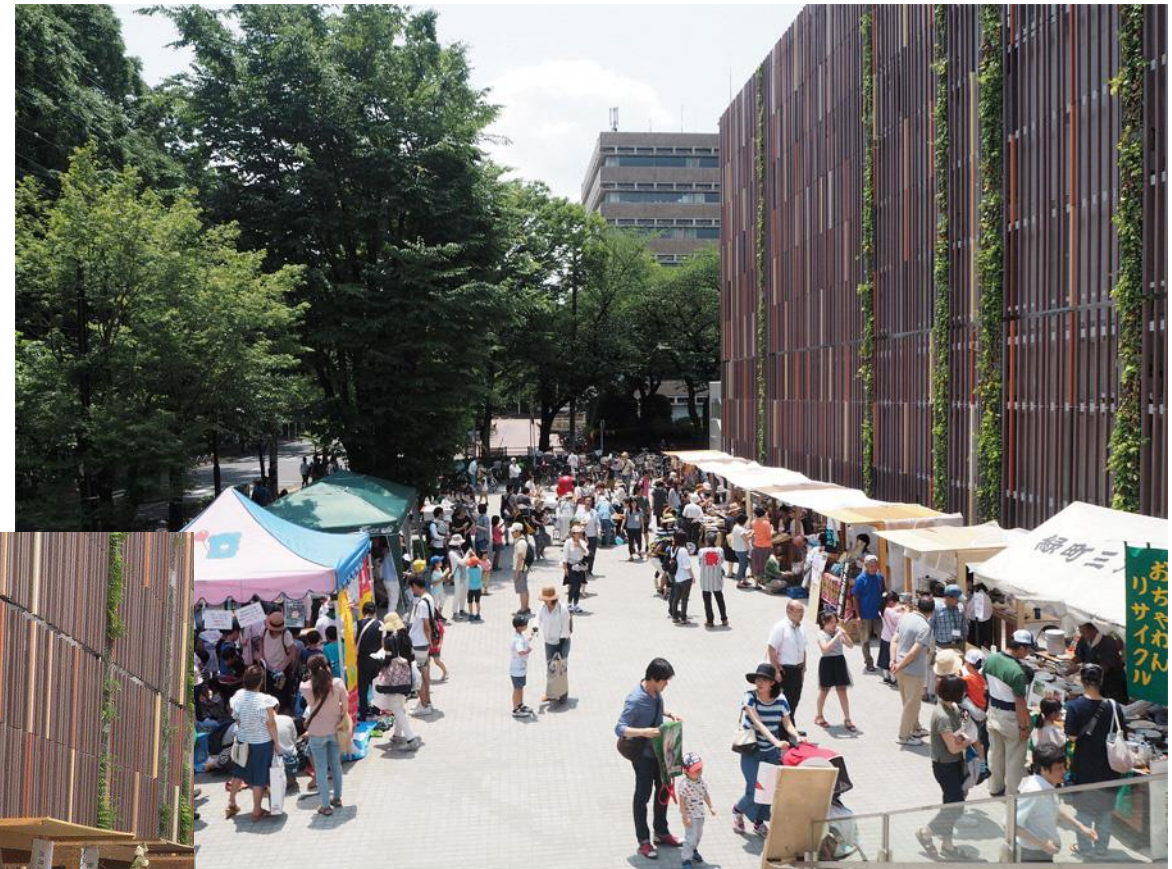
コミュニティスペース