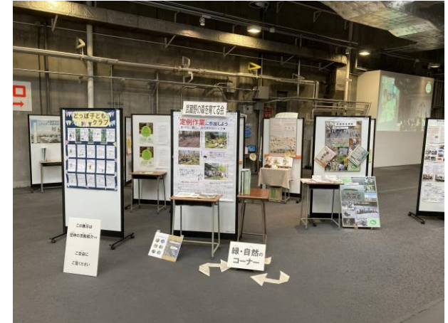
フリースペース：団体活動紹介