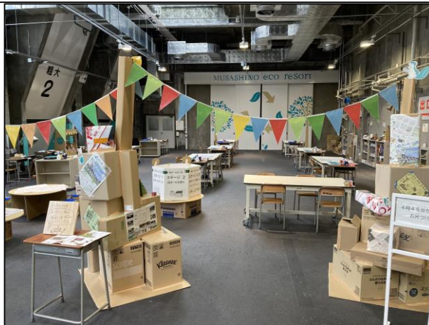
ものづくり工房：廃材工作