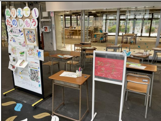
フリースペース：フェスタぬりえ