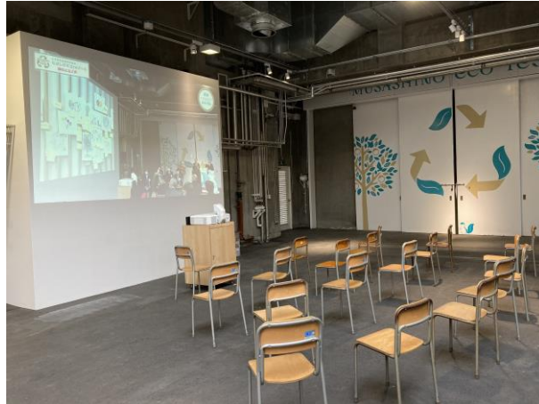
フリースペース：式典等映像