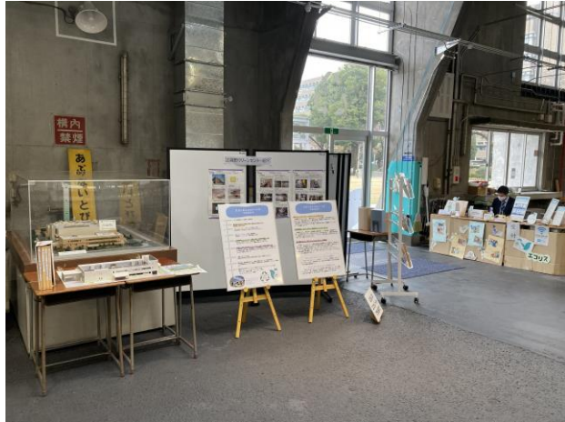
受付：来館者に開設経緯を説明