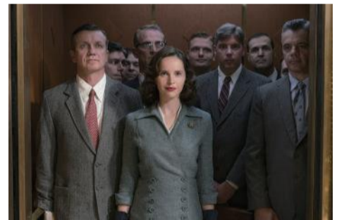
© 2018 STORYTELLER DISTRIBUTION CO., LLC.

上映時間 14:00~16:00 (13:30開場) 1回目上映 17:30~19:30 (17:00開場) 2回目上映