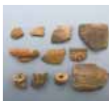
井の頭池遺跡群出土縄文土器