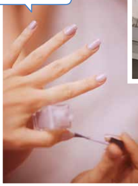
私のリラックスタイム♪