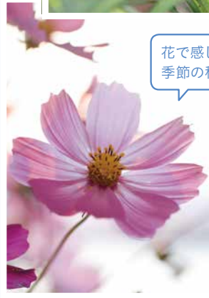
花で感じる季節の移ろい♪