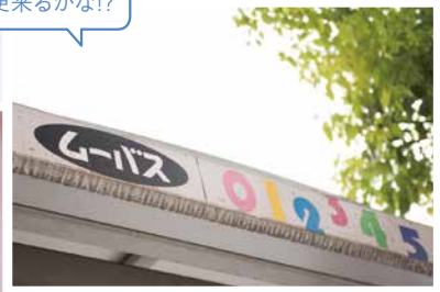
そろそろ次の便来かな!?