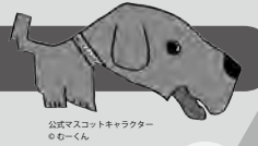
公武マスコットキャラクター のむーくん