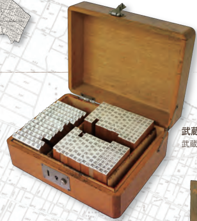
武蔵野市内町名印 武蔵野市蔵

本展では、武蔵野市域で呼びならわされ、使われてきた様々な地名を紹介します。この中には現在も使われているもの、既に使われなくなったものが存在します。その由来を探ることが困難になっているものもあります。地域の歴史や文化を含む市域の地名について改めて考えていただき、ご観覧の皆様の新たな知見となれば幸いです。