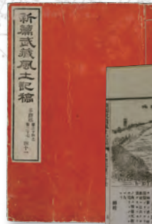
『新編武蔵風土記稿』