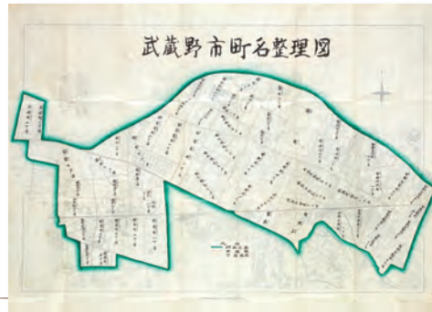
町名整理図 (第四次案) 昭和33年(1958)5月31日 武蔵野市歴史公文書