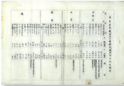
地名調ノ件 武蔵野市歴史公文書